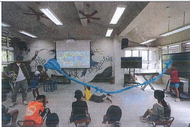
模擬情境，我可以怎麼做。