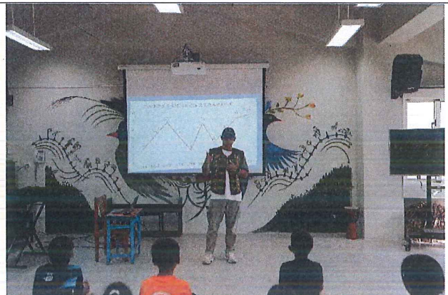
我們如何降低溺水事件