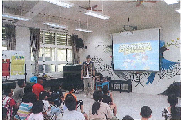
如何防溺讓玩水更安全